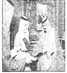
ويصالح عددا من الوزراء بديوان الرقابة