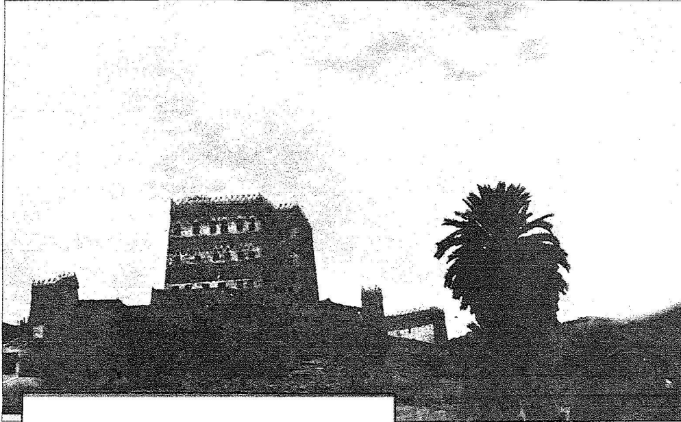
احد المواقع السياحية بنجران