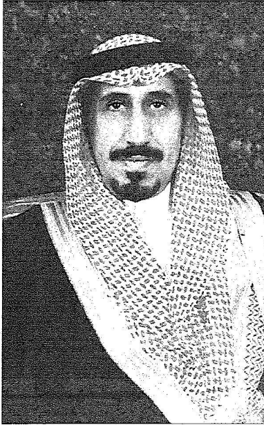
الامير مشعل بن سعود

هو معلوم قبل أشهر بالمنطقة الشرقية وهي تجيء بهدف تلمس الملك لاحتياجات مواطنيه وريثته والوقوف على ما انجز ويتجز كل منطقة اهائي نجران كانت افرأهم قد بدأت منذ يوم السبت المصادف لليوم الوطني ثم فرحة بدخول رمضان وفرحة العيد القادمة ستتواصل منذ اليوم الاول وحتى زيارة خادم الحرمين الشريفين حفظه الله.