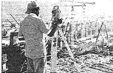
قياس دقيق لسير العمل

الجدير ذكره ان مشروع تطوير منطقة وجسر الجمرات يعد من أضخم المشروعات التي قامت بإنشائها حكومة خادم الحرمين الشريفين في المشاعر المقدسة لخدمة حجاج بيت الله الحرام حيث يعالج المشروع من خلال المدخل والمخارج مشكلة الاختناقات والتداغ في منطقة الجمرات كونه مخروجا على ١١ مدخلا و ١٢ مخروجا في الاتجاهات الأربعة تسهم في دخول وخروج الحجاج من وإلى الجسر أثناء توجههم لرمي الجمرات بكل يسر وسهولة، كما يعد المشروع قنلة حضارية وهندسية كونه يوفر بإذن الله الحماية لضيوف الرحمن أثناء توجههم لرمي الجمرات، ويحتوي المشروع على مواقع للخدمات تحت الأرض ونظام تبريد متطور يعمل على التكيف بنثر الرذاذ على الحجاج والمناطق