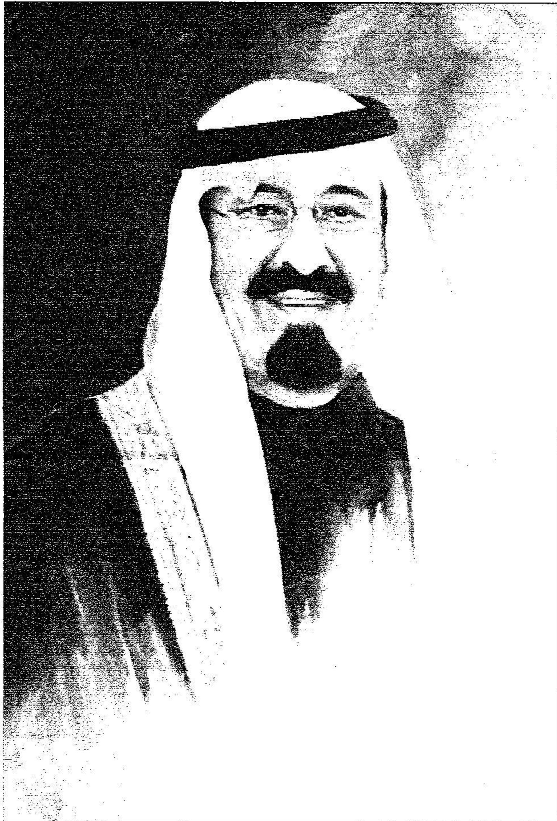
بورتريه للملك عبد الله بريشة الفنان عبده الفنانز يعرض في المعرض التشكيلي المصاحب لمهرجان الجنادرية.

التاريخ: 2010-03-17 رقم العدد: 15908 رقم الصفحة: 30 مسلسل: 187 رقم القصاصة: 5