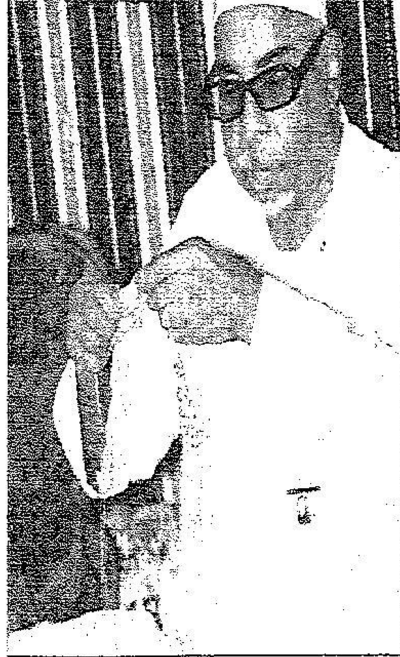
وأخر يطرز المشالج عشية افتتاح القرية.