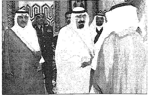
خادم الحرمين لدى وصوله جدة وولي العهد في مقدمة مستقبليه