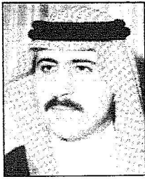
قيصلك بنت سلطات