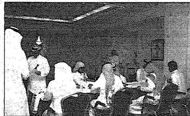
جانب من تسجيل الطلاب المبتعثين إلى الخارج