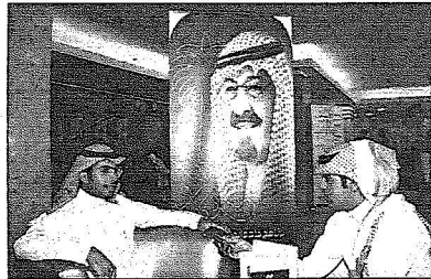
لقطتان من استقبال المتقدمين