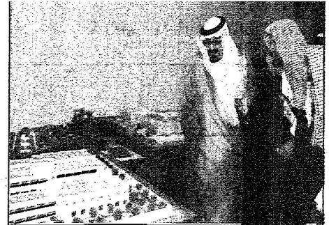
عظم الحرمين يسلم إلى طرح من وزير التربية عن مجسم لأحد المشروعات التطبيقية