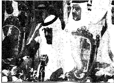
الملك عبدالله يعلن لتعيين أحد المشروعات