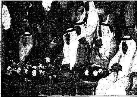
عظم الحرمين رأساً الحفل

المصدر : الرياض التاريخ : 27-07-2006 العدد : 13912 الصفحات : 2 المسلسل : 8