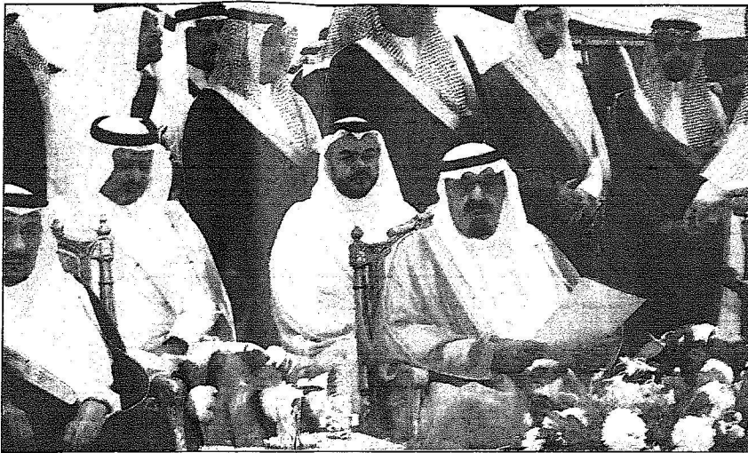
الملك عبدالله يتابع فقرات الحفل

■ رعى خادم الحرمين الشريفين الملك عبدالله بن عبدالعزيز حفظه الله بعد ظهر أمس حفل افتتاح ووضع حجر الأساس لتحديد من المشاريع التنموية بمنطقة الباحة وذلك بالسرايق المعد في محافظة العتيق.