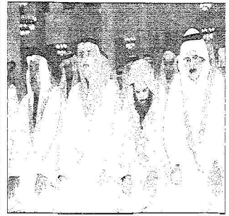
أثير نعد بن سلطان يتقدم المصلين بالجاءع الكبير في تبوك . . . وأب

يتقدمهم صاحب السمو الامير عبدالله بن عبدالعزيز بن مساعد أمير منطقة الحدود الشمالية وذلك في جامع سموه الكبير بمدينة عرعر. وأم المصلين فضيلة الشيخ علي العقبان الذي حمد الله وشكره على ان مكن المسلمين من الوقوف بصعيد عرفات الطاهر في جو مقعب بالروخانية والايامن تكاؤمهم عناية الهولى جل وعلا في ظل ما وفرته وهيأته لهم حكومة خادم الحرمين الشريفين الملك عبدالله بن عبدالعزيز وسمو ولي عهده الامين حفظهما الله من امكانات مادية وبشرية ومرافق خدمية ليتسنى لضيوف الرحمن تأدية مناسكهم المقدسة بيسر وطعانية.