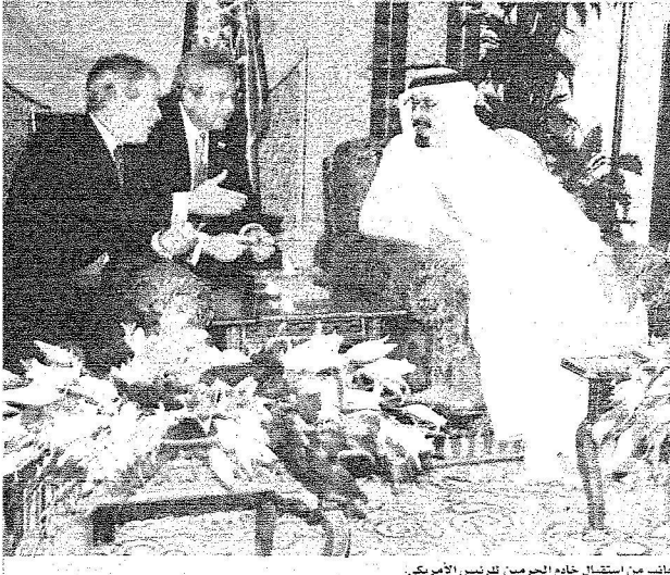
جانب من استقبال خادم الحرمين للرئيس الأمريكي.