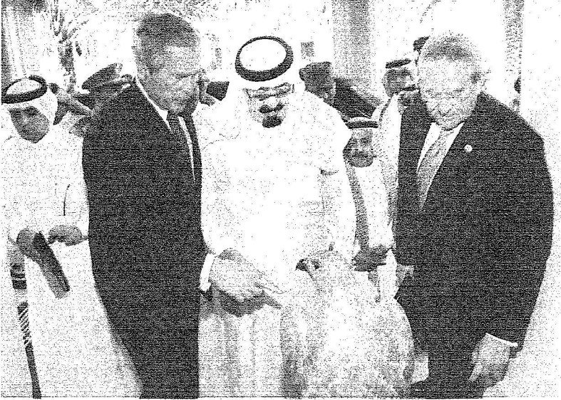
الملك يطالع على الهدية المقدمة من بوتس