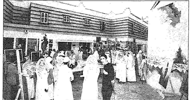
تجمع حول أحد الرسوم بمركز الملك فهد الثقافي