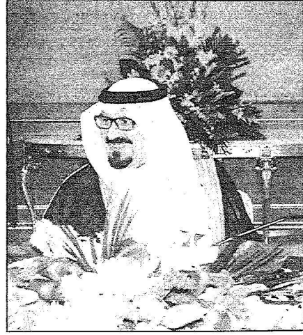
الأمير سلطان مقرئاً مجلس الوزراء (و.أ.س)