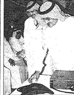
الأمير عبدالعزيز بن سعود يتفقد فلترا من أير سلفة كما حول المشروع