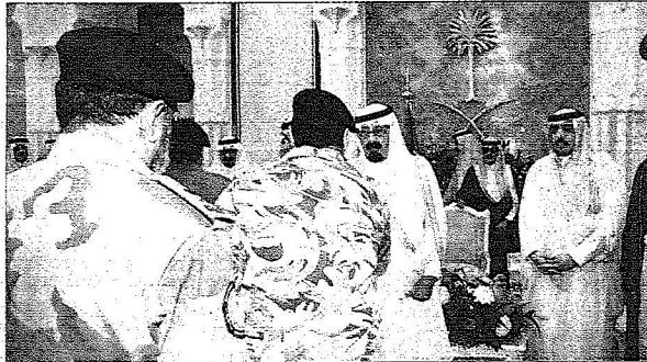
الملك يستقبل قادة وضباط أمن الحج

وصاحب السمو الملكي الامير ثايف بن عبدالعزيز وزير الداخلية رئيس لجنة الحج العليا وصاحب السمو الملكي الامير أحمد بن عبدالعزيز نائب وزير الداخلية وصاحب السمو الامير خالد بن قهد بن خالد وصاحب السمو الملكي الامير مقرن بن عبدالعزيز رئيس الاستخبارات العامة نائب امير منطقة مكة المكرمة في الحج واصحاب السمو الملكي الامراء. وتناول الجميع طعام الغداء على مائدة خادم الحرمين الشريفين.