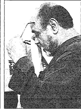
السجين أسـعـاودمع فرحة العقوف

ملك الإنسانية لكي يلحق بحفل زفاف ابنه وابنته في السابع من الشهر المقبل وكله إصرار على ألا يعود إلى قلمة السجن. أما النزيل ع - ق 22 عاما فقد حكم عليه بـ 4 سنوات في سرقة