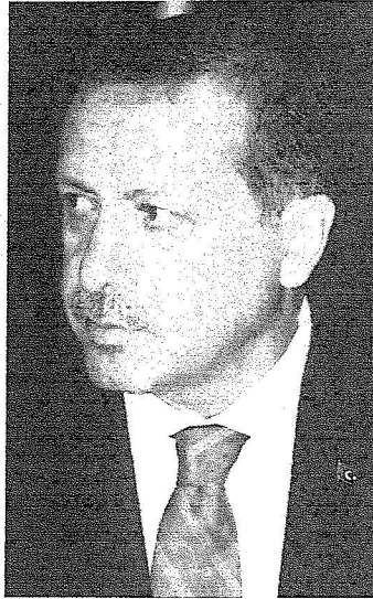
رجب الطيب اردوغان

الاستخبارات العامة وصاحب السمو الملكي الأمير بندر بن سلطان بن عبدالعزيز آل سعود التركي بن محمد الوطني وصاحب السمو الأمير تركي بن عبدالله بن محمد آل سعود مستشار خادم الحرمين الشريفين وصاحب السمو الملكي الأمير منصور بن ناصر بن عبدالعزيز وصاحب السمو الأمير الدكتور بندر بن سلمان بن محمد آل سعود مستشار خادم الحرمين الشريفين وصاحب السمو الملكي الأمير عبدالعزيز بن فهد بن عبدالعزيز وزير الدولة عضو مجلس الوزراء رئيس ديوان رئاسة مجلس الوزراء وصاحب السمو الملكي الأمير سعود بن عبدالله بن عبدالعزيز وصاحب السمو الملكي الأمير محمد ماجد بن عبدالله بن عبدالعزيز ومعالى وزير العمل الدكتور غازي بن عبدالرحمن القصيبي ومعالى وزير المالية الدكتور إبراهيم بن عبدالعزيز العساف ومعالى وزير الثقافة والإعلام الأستاذ أياد بن أمين مدني والشيخ مشعل بن عبدالله الرشيد ومعالى رئيس الديوان الملكي الأستاذ خالد بن عبدالعزيز التويجري ومعالى رئيس المراسم الملكية الأستاذ محمد بن عبدالرحمن الطيبي ومعالى رئيس الشؤون الخاصة لخادم الحرمين الشريفين الأستاذ إبراهيم بن عبدالرحمن الطاسان ومعالى مستشار خادم الحرمين الشريفين المشرف على العيادات الملكية الدكتور فهد العبدالجبار ومعالى نائب رئيس الديوان الملكي الأستاذ خالد بن عبدالرحمن العبيسي ومعالى المستشار بالديوان الملكي الأستاذ عادل الجبير وقائد الحرس الملكي الفريق أول حمد بن محمد الغوهلي ومعالى سفير خادم الحرمين الشريفين لدى تركيا الدكتور محمد بن رجا الحسيني. حفظ الله خادم الحرمين الشريفين في سفره وإقامته.