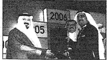
الأمير سلطان راعياً حفل كلية إدارة الأعمال