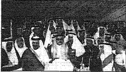
سموه لدى زيارته الحفل

المصدر : الرياض التاريخ : 29-06-2006 العدد : 13884 الصفحات : 2 المسلسل : 11