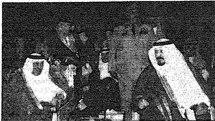
سموه راعياً حفل وضع الحجر الأساس لمشروعات الوحدات التدريبية