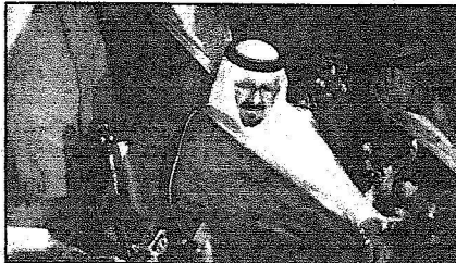
وفي العهد وضع الحجر الأساس لمشروعات التعليم الفني

جدة - صالح الرويس، ياسر الجاويشة، صلاح الشرف، تصوير - محسن سالم ■ أعلن صاحب السمو الملكي الأمير سلطان بن عبد العزيز ولي العهد نائب رئيس مجلس الوزراء وزير الدفاع والطران والقطن العام تبرعه بمبلغ 2٠ مليون ريال لتصالح كلية إدارة الأعمال بجدة. جاء ذلك خلال رعايته مساء أول من أمس حفل تخريج أول دفعة من حملة درجة البيكالوريوس من كلية إدارة الأعمال الأهلية بجدة، ووضع حجر الأساس لكلية الهندسة وتقنية المعلومات بحضور عدد كبير من أصحاب السمو الملكي الأمراء والمسالي الوزراء وكبار المسؤولين وشخصيات الدولة والأكاديميين ورجال الأعمال. ولدى وصول سموه مقر الحفل استقبله فرقة فلكتور أبو سراج ثم مسيرة الخريجين. بعد ذلك بدأ الحفل بتلاوة آيات من القرآن الكريم للشيخ سجاد الحسن شيخ القراء ومعه الكرامة بعدها شاهد الجميع طليما وثالغيا عن الكلية. ثم ألقى صاحب السمو الملكي الأمير سلطان بن عبد العزيز كلمة قال فيها: بأنها الاخوة الكرام إن السعادة ليست في المال ولكنها في الرجال اشم في هذا المجال تخلفون الرجل عملاً بعد فضل الله سبحانه وتعالى، «أها الأخوة الكرام إن هذه الكلية وهذا المعهد وما يشطور عنه في المتقبل هو جديد في التعاون المستمر من جميع الجهات والرجال ومن رجال الدولة، كما يتنموا ويستمر لتلك تأكيذاً قاطعاً وإن