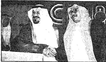
محلان يتشرف، والسلام على الأمير سلطان