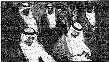
الأمير سلطان يحضر توقيع الاتفاقية بين مؤسسة التعليم الفني وشركة الفوران