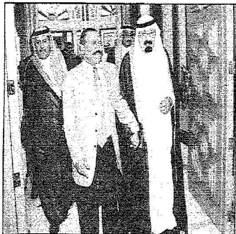
خادم الحرمين في وديع الرئيس صالح