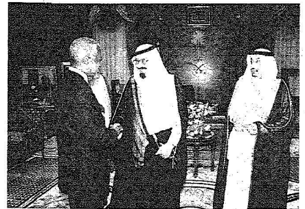
خادم الحرمين لدى استقباله الأمين العام للأمم المتحدة