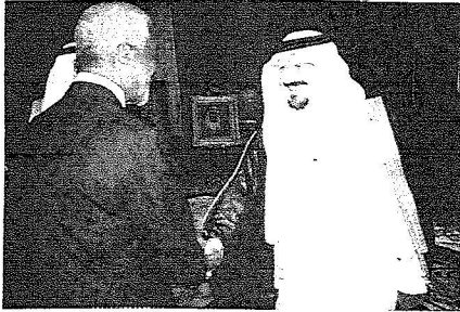
الأمير سلطان يصفاح كوفي عنان

بعد ذلك جرى بحث مجمل المستجدات في المنطقة وفي مقدمتها تطورات الوضع في لبنان ودور الأمم المتحدة في تطبيق قرار مجلس الأمن الدولي رقم ١٧٠١ والمحافظة على سلامة لبنان ووحدة أراضيه.