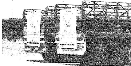
المساعدات السعودية للشعب اللبناني