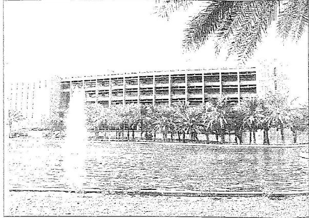
معهد البحوث بجامعة الفهد