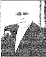
د. خالد قباني

السلطان: رعاية الملك تقدير لأهمية المؤتمر ومكانة التعليم والبحث العلمي