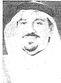
الأمير الدكتور فيصل بن مشعل بن سعود