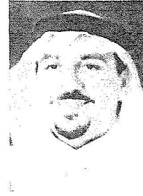
نائب أمير القصيم