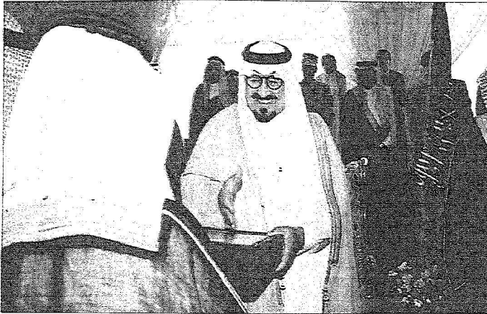
.. وسمو ولي العهد بتعلم حديثه