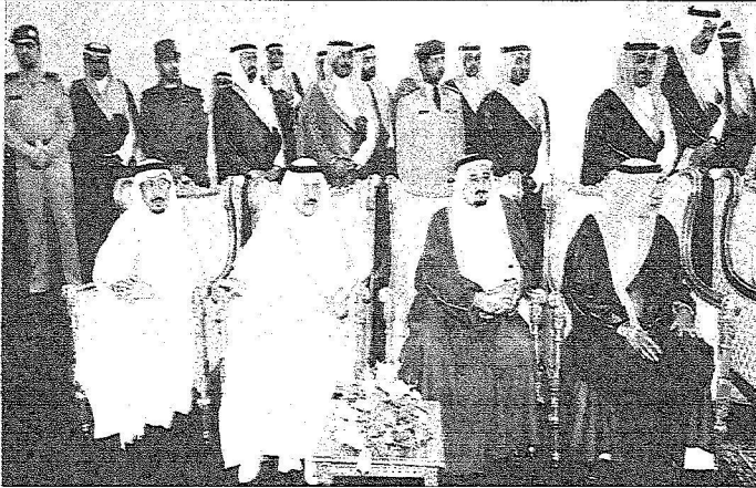
الأمير نايف وعدد من أصحاب السمو الملكي الأمراء في الحفل