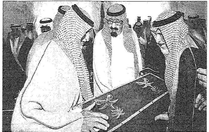
خادم الحرمين الشريفين بتعلم هدية مشايخ القبائل