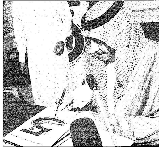
الأمير سلطان يعتمد الشعار