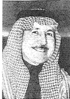
الأمير سلطان بن عبدالعزيز