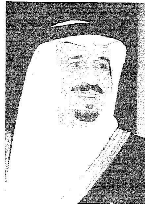
الأمير سلمان بن عبدالعزيز