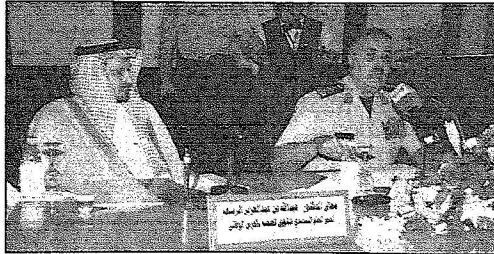
سموه يتحدث بالمؤتمر الصحفي ويبدو د. الربيعه