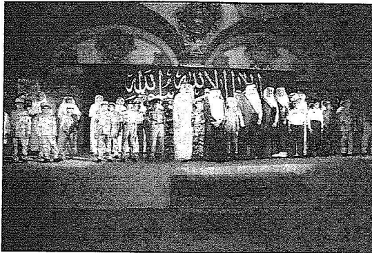
سمود في صورة جماعية مع المتفوقين