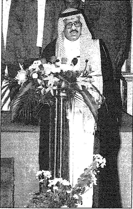
سموه متحدثاً في الحفل