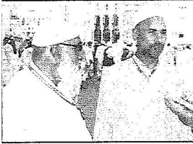
اقبال من باكستان