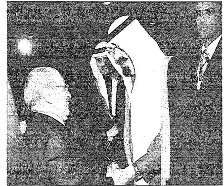
لقطات من حفل العشاء التكريمي الذي أقامته الأمم المتحدة تكريماً لخدام الحرمين الشريفين