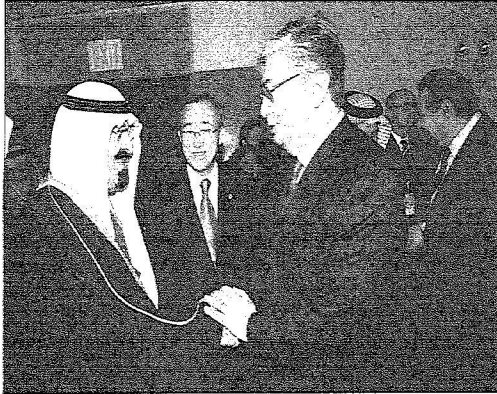
نيويورك - واس

أقام معالي الأمين العام للأمم المتحدة بان كي مون في مقر المنظمة بنيويورك مساء أمس الأول مأدبة عشاء تكريماً لخادم الحرمين الشريفين الملك عبدالله بن عبدالعزيز آل سعود - حفظه الله - وأصحاب الجلالة والفخامة والسمو والدولة قادة وزعماء وممثلي الحكومات لختف دول العالم الذين سيشاركون في الاجتماع عالي المستوى للحوار بين الأديان والثقافات والخسارات الذي ينعقد بمقر الأمم المتحدة في نيويورك استجابة لدعوة خادم الحرمين الشريفين أيده الله.