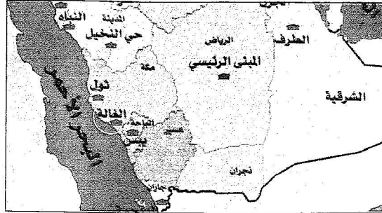
خريطة توزيع مشروعات المؤسسة الإسكانية