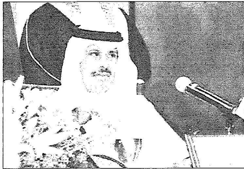
الامير مشاري يلقي كلمته في افتتاح المؤتمر أول من امس