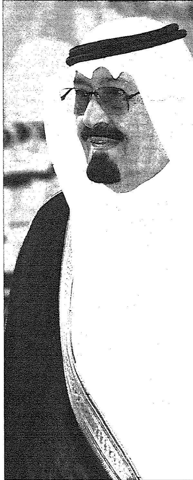
خادم الحرمين الشريفين

وقد أكدت اللجنة المنظمة للمعرض أن المعرض يهدف إلى إظهار النهضة التنموية التي تشهدها منطقة مكة المكرمة في عهد خادم الحرمين الشريفين الملك عبدالله بن عبدالعزيز آل سعود، وسمو ولي عهده الأمين صاحب السمو الملكي الأمير سلطان بن عبدالعزيز آل سعود محافظيها الله، وتحت قيادة أمير منطقة مكة المكرمة صاحب السمو الملكي الأمير خالد الفيصل بن عبدالعزيز. ويبدأ الحفل بافتتاح خادم الحرمين الشريفين للمعرض، يليه عرض