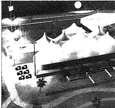
أحد المشاريع المشاركة

بمدينة جدة وسيستمر من ١١ شوال وحتى ١٣ محرم، وسوف يكون مفتوحا للجمهور مجانا وسوف يكون مزودا بمواقع