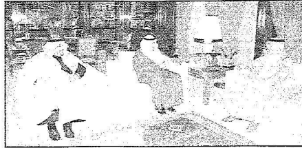
الأمير فيصل بن بندر خلال استقباله الأمير فيصل بن عبد الله بحضور الأمير الدكتور فيصل بن مشعل