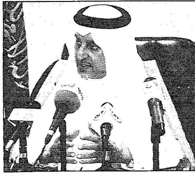
الإمام خالد الفيصل يتحدث في المؤتمر الصحافي

باعتماد هذه الخطط واشراف سموه على تنفيذها مؤكدا سموه ان امانة منطقة مكة المكرمة جزء من وزارة الداخلية تتابع وتشرف على تنفيذ الخطط اضافة الى ما تقوم به القيادات الميدانية والجهات المعنية بتنفيذ الخطط التشغيلية سواء كانت امنية او مدنية وتمنى سموه ان يشعر كل من ساهم في تنفيذ خطط موسم حج هذا العام اننا نقدر له جهده وندين له بالفصل في اداء هذه الخدمة وأخلاصه وتفانيه في اداء العمل الذي اخرج موسم حج هذا العام بهذه الصورة وهذا النجاح وهذا لا يعني ان هذا كل ما تصبو اليه القيادة واننا نوصلنا الى ما نريد وان ما وصلنا اليه هو خطوة الى الامام ويعني اننا استطعنا ان نقول ونثبت لانفسنا وللعالم اجمع ان لدينا احسن مما كان للخدمات التي تقدمها حكومة خادم الحرمين الشريفين . وفيما يخص معالجة حجج سكان مكة المكرمة اكد انه لا بد من معالجة هذا الموضوع وهو من الموضوعات التي يجب ان تعالج مستقبلا من ناحية تحويلهم الى المشاعر المقدسة وكيفية الاسلوب الذي سيتبع في معالجة هذا الموضوع ويجب ان تكون هناك دراسة متكاملة لهذا الموضوع تتشارك فيها كافة الجهات المعنية وتقديم تصور منطقي ومفعول لتفسيها . وافاد سمو امير منطقة مكة المكرمة ان طريقي مكة جدة السريع وطريق مكة جدة القديم اصبحا غير كافيين لتغطية نقل القادمين من وإلى مكة المكرمة . وهناك دراسة مع وزارة النقل لكافة الوسائل بما فيها القطارات واستحداث الطرق الجديدة التي من الممكن احتياجها وعندما يتم الانتهاء من هذا الدراسة سيتم الاعلان عنه في حينها مشيرا الى ان الطريق الذي يربط جدة بالمجموع بمكة يجري العمل فيها حاليا سيتم الانتهاء منه قريبا .