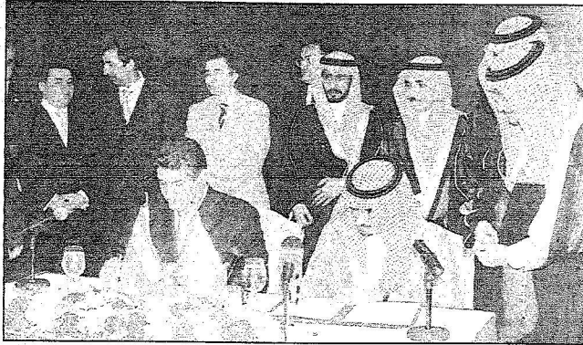
سموه يوقع اتفاقية مع الوزير الأذري