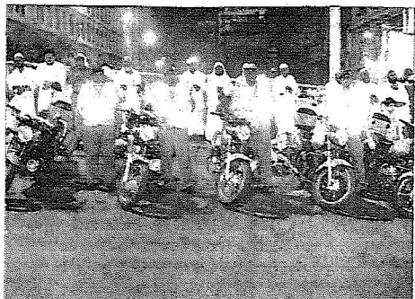
حاضرية كاملة لأفراد الأمن