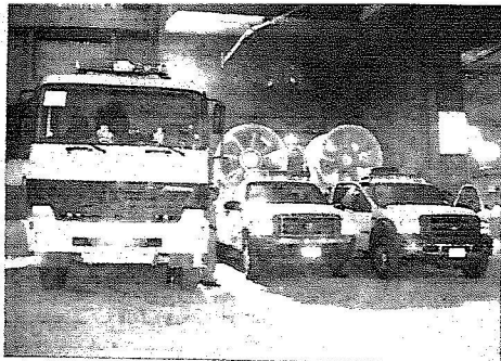
سيارات الدفاع المدني على قدم وساق

وقال إن تطبيق الخطة بدأ من غرة شهر رمضان المبارك حيث تم دعم موقف إدارة العاصمة المقدسة بـ ٤٢٠٠ ضابط وفرق وتشمل دوريات سلامة راكبة ورجالة وفرقا ميدانية كما تم دعم الموقف بـ ٨٠٠ نية ومعدة فنية، و٣ طائرات عمودية.