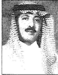
الأمير فهد بن عبد الله

وثمانين ألف مليون ريال سيكون لها الأثر الكبير في زيادة عدد المشروعات المعتمدة لكثير من القطاعات الحكومية التي استبشرت بهذه الميزانية، حيث إن حكومة خادم الحرمين الشريفين -حفظه الله- دأبت على خطى ثابتة في تنفيذ استراتيجيتها الإصلاح الاقتصادية التي تضع في مقدمة أولوياتها التنمية البشرية التي تضمن بمشيئة الله أفضل مستقبل ممكن للمواطن ولعل قراءة سريعة لمخصصات الميزانية الجديدة تؤكد لنا مدى الاهتمام بالشارع ذات العائد الاجتماعي والتنموي المرتفع وفي مقدمة تلك قطاعات التعليم