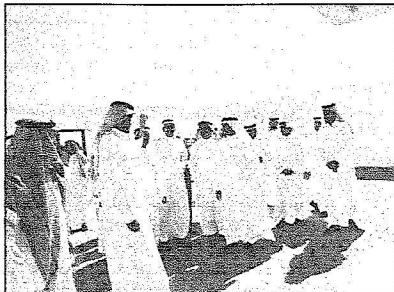
وكيل الوزارة ورؤساء المراكز ومديري الجهات في سلوى في جولة ميدانية لأحد المشاريع

كما كشف لـ «الرياض» الحذاء عن زيارة قريبة لمساعد مدير عام الجمارك السعودية لسوق على المراحل التطويرية والنهائية في تلك المشاريع الكبيرة والمقامة في المنفذ.. وكشف لـ «الرياض» أن من أهم تلك المشاريع المشروع السكني والذي يحتوي على