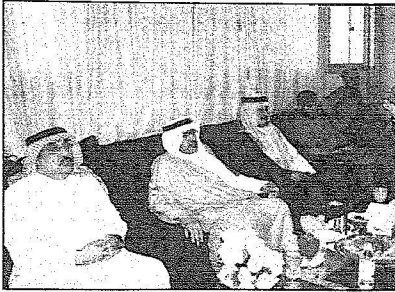
جانب من الزيارة في منفذ سلوى الحدودي

وزارة المالية للخدمات المركزية الأستاذ محمد بن عبدالرحمن المقطب والوفد المرافق له زيارته التفقدية في منفذ البطحاء الحدودي مع دولة الإمارات العربية المتحدة حيث اطلع على آخر الاستعدادات لاستقبال وفود الحجاج كما وقف في منفذ البطحاء الحدودي على آخر المراحل التطويرية لعدد من المشاريع التطويرية في منفذ البطحاء الحدودي والتقى رؤساء المراكز ومديري الجهات الحكومية بالمنفذ واستمع إلى متطلباتهم وأرائهم.. الجدير بالذكر انه كان يرافق سعادته في هذه الزيارة عدده من المسؤولين والمستشارين بوزارة المالية السعودية.