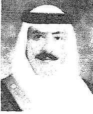
الأمير بندر بن سعود بن محمد آل سعود

جميع المناطق المحمية القائمة حالياً، وفقاً للنتائج التي تم اتخاذ القرار بعد عرضها على مجلس إدارة الهيئة الموقر، وحدث فعلاً هناك تقليص للمساحة المحظورة فيها الرعي في محمية حرة الحرة في الشمال دون مساس بالمساحة الكلية للمحمية وذلك لإتاحة فرصة أكبر للمواطنين لاستخدامها في الرعي ودعم كفاءة جهود الحماية وإدارة المنطقة.