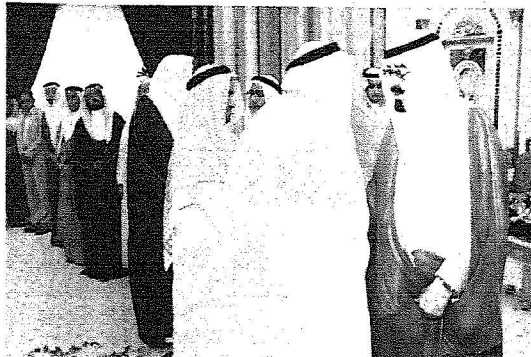
الملك مستقبلاً المشايخ والمسؤولين وجمعاً من المواطنين المهتمين بسلامة الوصول إلى جدة