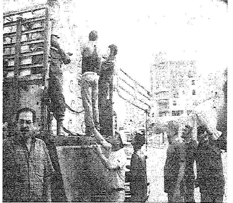
لقطات من الحصة