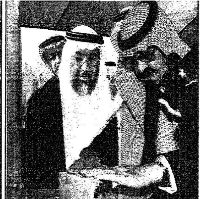
خادم الحرمين يضع الحجر الأساس للمبنى الجديد

اطلع على سير العمل في المشروع ووجه بمضاعفة الوحدات السكنية في السنوات القادمة