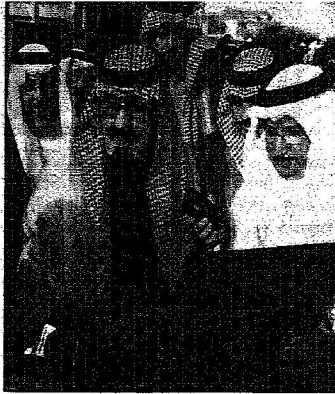
خادم الحرمين يتسلم التقرير المؤسسي السنوي خلال الحفل

المصدر : الرياض التاريخ : 16-03-2006 العدد : 13779 الصفحات : 2 المسلسل : 4