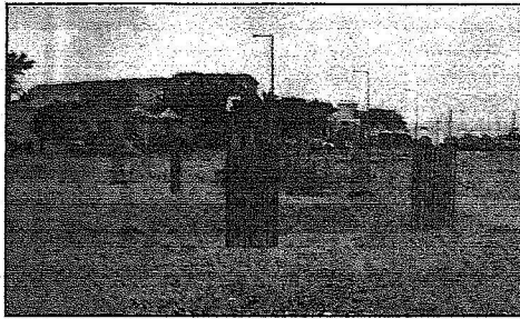
جانب من الأعمال الإنشائية للمبنى

الأرض هبة سخية منه - حفظه الله - للمؤسسة وتبلغ مساحتها عشرة آلاف متر مربع مؤكداً ان مبنى الأمانة سيكون معلماً حضارياً يضاف لمعالم العاصمة ويبت خيرة في مجال الاسكان التنموي لخدمة الفئات الأكثر حاجة في المجتمع وخدمة الباحثين والمهتمين والاختصاصيين في مجال الاسكان الميسر كما سيوفر المبنى