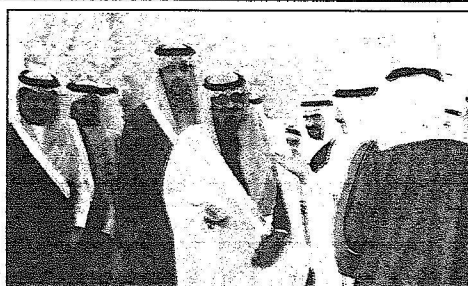
الملك عبدالله خلال جولته التفتيشية على أرض المشروع

رعى خادم الحرمين الشريفين الملك عبدالله بن عبدالعزيز آل سعود رئيس مؤسسة الملك عبدالعزيز لوالديه للأمانة التنموية حفظه الله أمس حفل وضع حجر الأساس لمبنى المقر الدائم للأمانة العامة للمؤسسة في الأرض المخصصة للمشروع بجوار