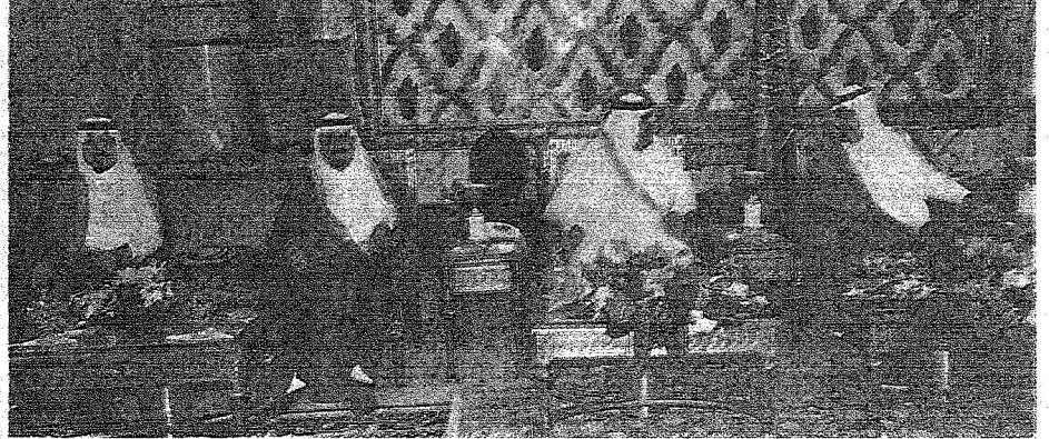
خادم الحرمين الشريفين في حديث لشوي مع أمير قطر بحضور رئيس هيئة البيعة وولي العهد