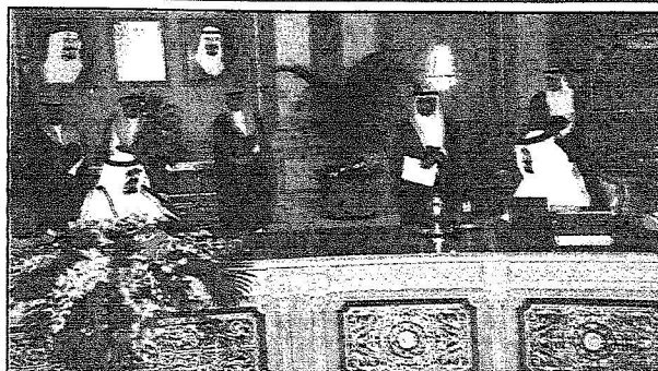
خادم الحرمين الشريفين يترأس جلسة مجلس الوزراء

قراري مجلس الشورى رقم ٧٣/١٠هـ وتاريخ ١/٢٤/١٤٢٥هـ ورقم ٥٨/٧٨هـ وتاريخ ١٢/٢٢/١٤٢٦هـ. قرر مجلس الوزراء الموافقة على نظام البنك السعودي للتسليف والادخار بالصيغة المرفقة بالقرار.. وقد أعد مرسوم ملكي بذلك.