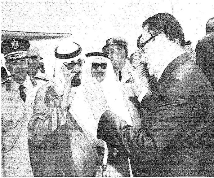
خادم الحرمين الشريفين لدى معادركه مطار برج العرب في الإسكندرية أمن، وطني وناحه الرئيس محمد حسني مبارك.