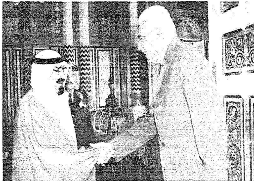
الملك مستقبلاً أحمد نقيب رئيس الوزراء المصري.