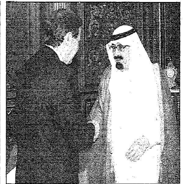
لكه عبدالله خلال استقباله وزير التجارة المصري د. أ. س.