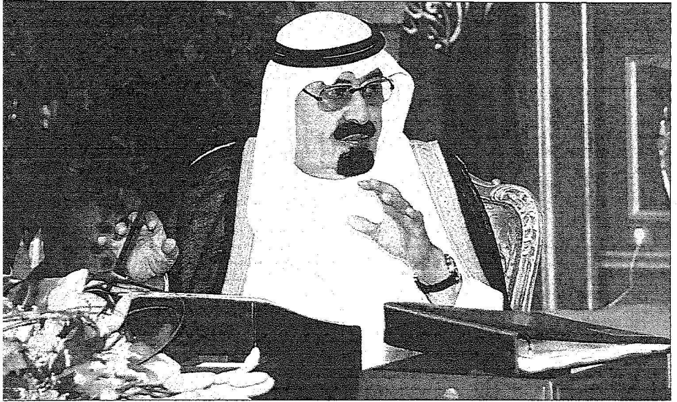
خادم الحرمين الشريفين متروئساً جلسة مجلس الوزراء في جدة أمس