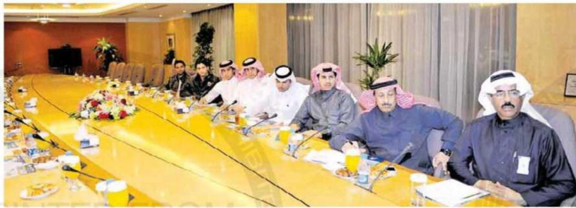
جلب من الحضور

الإجراءات التي اتخذناها وفي أمريكا كانت نسبة عدد معاملات الموظف 12.5 معاملة وخلال ثلاثة أيام أصبحت 35 معاملة بعد متابعتنا لهم، ولو قام الطلبة بمساعتنا وسجوا بأناتهم نستطيع التواصل مع المشرفين، وأريد أن أؤكد أن الابتعاث حقق أهدافه، كنا نهدف له