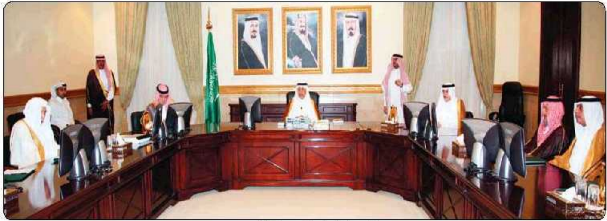
الأمير خالد الفيصل خلال ترؤسه اجتماع المؤسسين

وشكلت عدة لجان توصلت إلى رؤية ورؤية عرضت على سمو الأمير وطبعاً كان مشاركا فيها وتنت الموافقة عليها، وعلى مبدأ التجربة السنغافورية سينتهي الأمر من تأسيس إلى هناك لعقد ورش عمل معهد وعلى ضوءها سيبدأ التدريب في المركز.